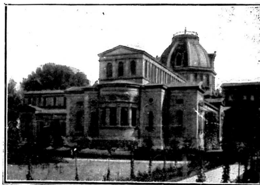
A MARGITSZIGETI FÜRDŐ.

A Magyar Mérnök- és Építész-Egylet eleintén csak kebelbeli, inkább családias jellegű ünneplést tervezett, de a rendezés során a szakkörök lelkes érdeklődése a társadalom minden rétegében oly élénk visszhangot keltett, hogy az ünnepély tényleg országossá nőtt, a mennyiben a Vigadó nagytermében megtartott lakomán nemcsak hogy négy miniszter jelent meg a kormány képviselőjében, hanem ott voltak: a képviselőház elnöke, a főváros három polgármestere, Pest vármegye fő- és alispánja és Székesfehérvárnak, az Ybl szülővárosának küldöttsége, ott voltak: a Tudományos Akadémia képviselői, az Egyetem és a Műegyetem rektorai, számos író, élükön Jókai Mórral, a tesvérművészetek: a szobrászat és főtészet képviselői, Huszár Adolfal és Lotz Károlylyal és ott volt a kar- és szaktársak szinte végelláthatatlan sora, mindannyian lelkes örömmel üdvözölve a modern magyar építőművészet dicsőségkoszorúza ősz „atyamesterét”. De sőt a haza határain kívül is lelkes érdeklődéssel fogadták a művész-jubileum hírért s az Oesterreichischer Ingenieur- und Archi-