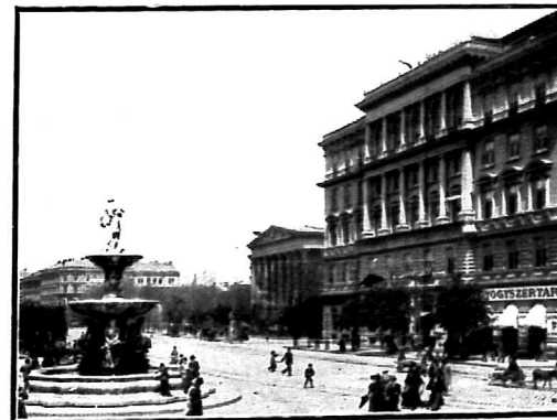
AZ ELSŐ HAZAI KÁLVINTÉRI PALOTÁJA ÉS SZÖKÖKÚTJA.

gyar modern építőművész. Az ő föllépését és működését megelőző időkben ugyanis, építőművészeti tevékenységről hazánkban egyáltalán alig lehetett szó. Így volt egészen a múlt századnak körülbelül első harmadáig, a Pollák és Hild koráig, akik, és velük még néhány többé-kevésbé jelentős kortársuk, a klasszikus stílusok komoly tanulmánya alapján, e formák nemes egyszerűségét igyekeztek meghonosítani építményeiken, de ebben aztán nem ritkán annyira mentek, hogy műveik olykor, sőt legtöbbször csaknem szárazakká, szinte ridegekké váltak s a különben is kevés ilyenmű fogékonysággal bíró közönségnek alig bírták az építőművészet iránti érdeklődését fölbreszteni. Szóval, akkori építőművészetünk, mondhatni szinte kizárólag a görög-római tektonika alapján állott s a festői elemet csaknem teljesen nélkülözte; holott — hiszen ez eltagadhatatlan — az építőművészet-