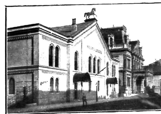
A LOVARDA ÉS KÁROLYI ALAJOS GRÓF PALOTÁJA.

És e mellett az építőszerkezetek tökéletesítése s a monumentális építőanyagok megfelelő alkalmazását sem kerülte el figyelmes gondoskodását; hiszen feledhetjük-e, hogy a modern Budapestet.