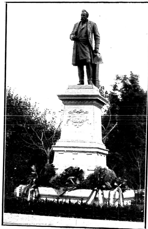
YBL MIKLÓS SZOBRA BUDAPESTEN.

S ezt a hódolatot Ybl Miklós, művészet-fejlesztő munkásságának érdemei révén méltán megérdemelte. Mert viszapillantva az ő működése előtti sivár időkre, föltétlenül el kell ismer-nünk, hogy az építőművészet tudatos és pedig nem csupán a vonalak és idomok többé vagy kevésbé tetszetős játékában, hanem a monumentális anyagok (faragott kő, vas és cément) és a fölmerült modern szerkezetek észszerű alkalmazásában is megnyilatkozó ápolása itt nálunk, vele, általa kezdődött s hogy ő, a mindjobban bokrosodó építőművészet fejlődésnek mindvégig, élte fogytáig, ve-