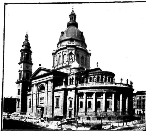
A LIPÓTVÁROSI TEMPLOM.

Ybl Miklós 1835-ben Prágába került Koch József bécsi építőművész mellé, aki a gr. Kinszky-féle palotát építette ott, négy év múlva pedig 1839 elején, rövid időre a müncheni művészakadémiát látogatta. Ugyanezen év második felében aztán tanulmányi utra indult Olaszországba, mely utazás döntővé lett egész építészeti fejlődésére nézve. Ekkor érezte át ugyanis teljesen és kedvelte meg az olasz renaissancet s e stílusban alkotta meg később legkiválóbb remekeit. Hazatérte után 1841-ben a művészetkedvelő nagylelkű mecénás gr. Károlyi István látta el megbízásokkal, akinek legelőbb főthi kastélyát rendezte be, majd az egykori román stíliú lebontott kaplonyi templomot állította helyre, végül pedig, mint első remekét, megalkotta a főthi templomot. Ez az építkezés teljesen lekötötte őt, úgy hogy Főthra ment lakni is, ahol 1846—51-ig maradt. 1851-ben pártfogója Károlyi István gróf költségén másodsor utazta be Olaszországot, honnan vissza-