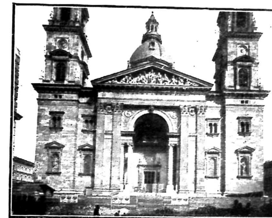
A LIPÓTVÁROSI TEMPLOM.

Munkásságának ezinté beláthatatlan sorozata Ybl Miklós csodás munkabírásának bizonyítéka és annak a fáradhatatlan szorgalomnak, amelylyel több mint öt évtizeden keresztül dolgozni meg nem szűnt. A folytonos haladás és fejlődés: ez