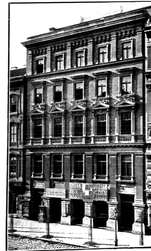
BÉRHAZ. MÚZEUM-KÖRÚT 19.

Ybl Miklós Székesfehérváron, 1814 április 16-án született. Atyja jómódú ottani kereskedő volt, s ő elemi és középiskoláit szülővárosában végezte, 1828-ban pedig a bécsi politechnikumra ment, honnan 1832-ben, 18 éves korában visszakérülve, Budán az országos építészeti igazgatóságnál keresett állást, de ott zárt ajtókra talált s így kénytelen volt mint önálló magán-építész keresni boldogulást. A főnállott céhrendszer mellett ez azonban csakis az építőmesteri képesítés megszerzése útján volt lehetséges. Törhetetlen akaraterejét mutatja, hogy mint műegyetemet végzett technikus nem restelt beállani kőművesinasnak, hogy a törvény követelte képe-sítést megszerezze. Tanoncideje leteltével Pollák Mihály pesti építész és építőmesternél talált alkalmazást, kinek oldalán 4 esztendeig működött. Ez időben dolgozott mestere az esztergomi bazilika tovább-építésén, építette az egri székesegyházat, restaurálta a pécsi székesegyházat és kezdte építeni a Nemzeti Múzeum klasz-szikus szépségű épületét.