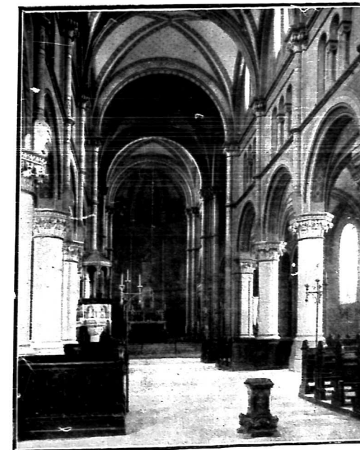
A BAKÁCSTÉRI TEMPLOM.