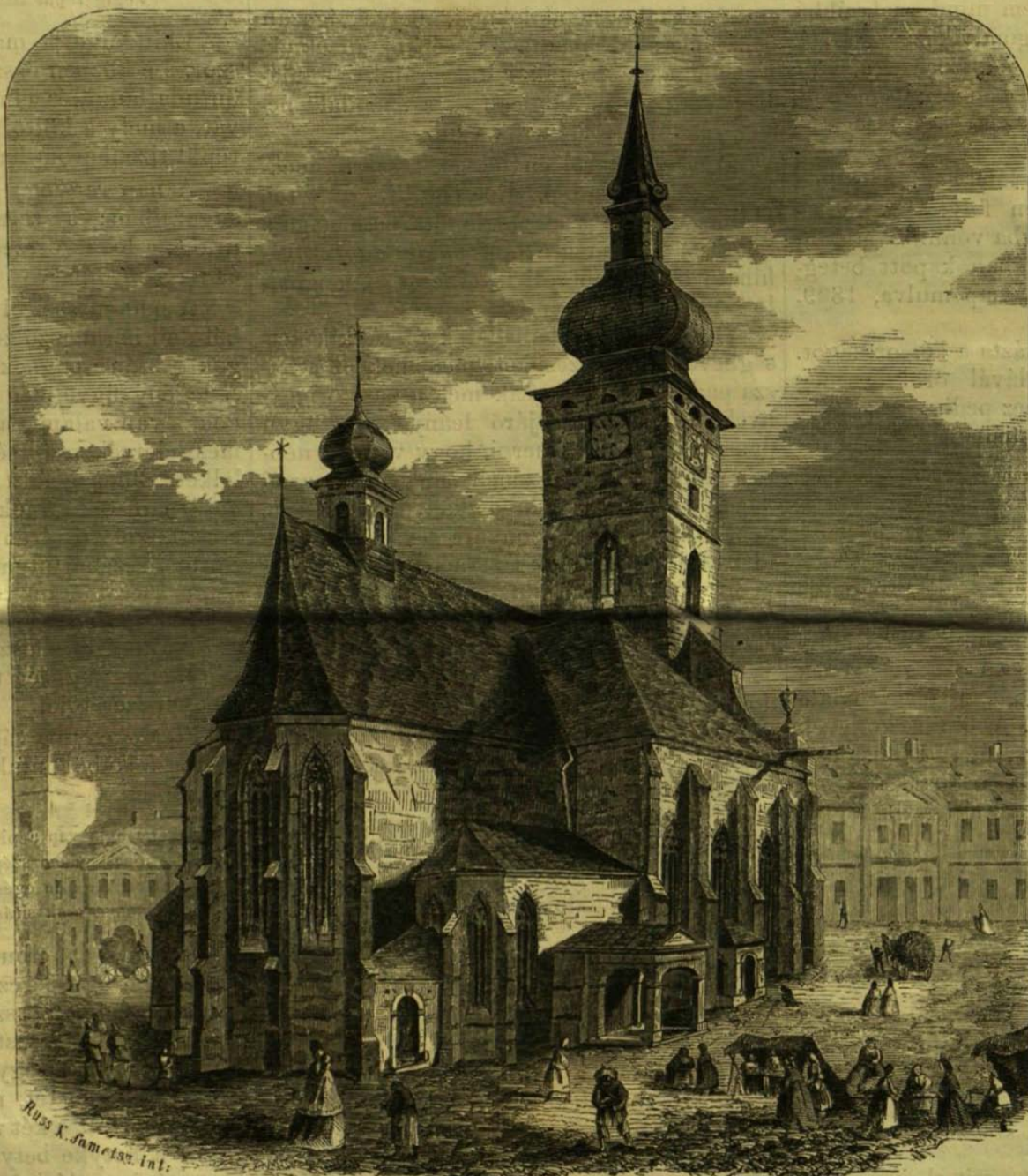
Az eperjesi r. kath. templom. — (Mykovszky rajza után Greguss János)

A sekrestye régen más helyen lehetett, jelenleg a templom déli oldalához van építve, és a mint építésmódoráról láthatni, későbbi időkben keletkezhetett. A templom