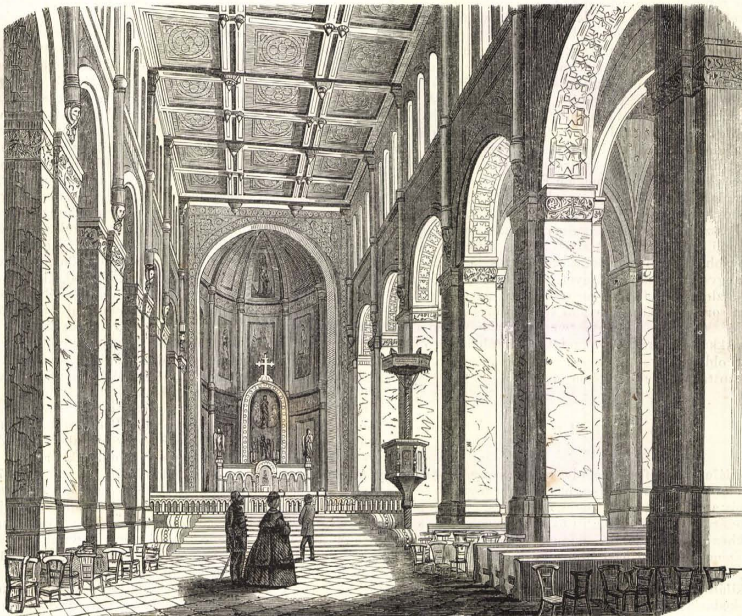
A főthi templom belseje.