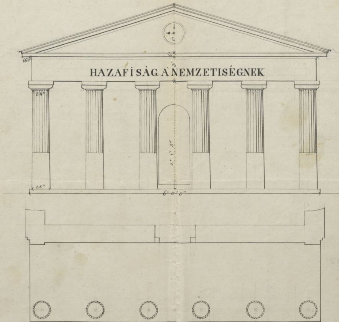
a' B. Türedi színház homlokzatának rajza.

6' 5' 4' 3' 2' 1' | 1' | 2' | 3' | 4' | 5'