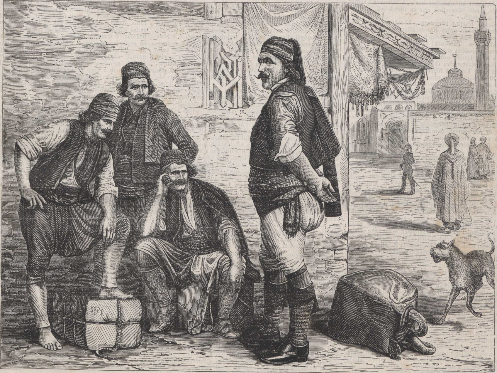
Konstantinápolyi hamálok (teherhordók.)

A mi képviselőházunk ülésterme tagadhatlanul nagyon jól és szépen van berendezve. A felülről