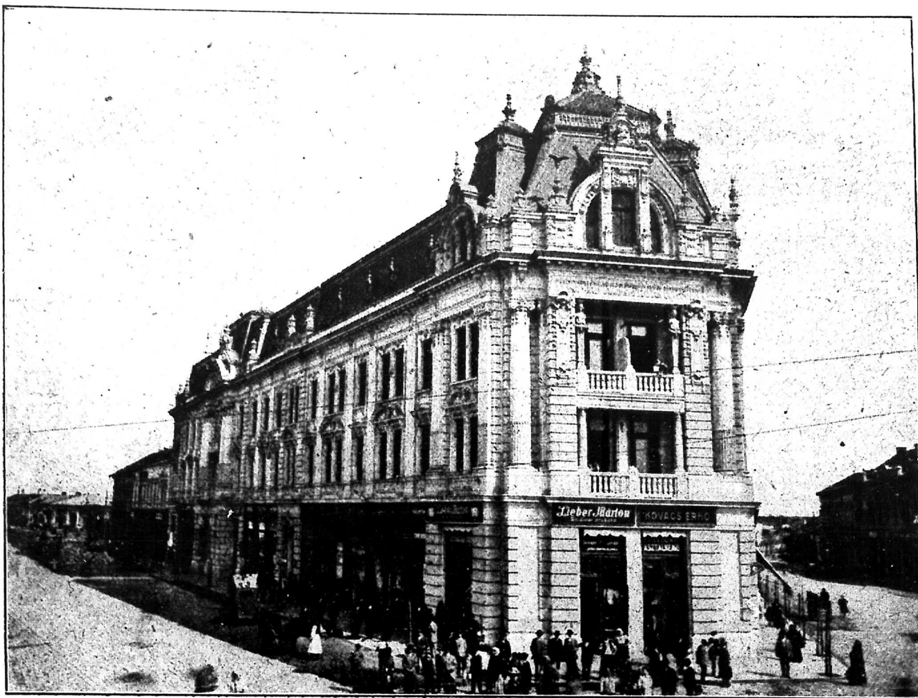
1. ábra. A nyiregyházi takarékpénztár épülete.

Az épületben négy udvar van, melyek közül a Vay-Ádám-utca felé eső egy tágas bejáróval ellátott udvar, a szintén a takarékpénztár birtokában lévő és 1912—1913. évben átalakított épület udvarával egy bazárszerű átjáró udvarra egyesített.