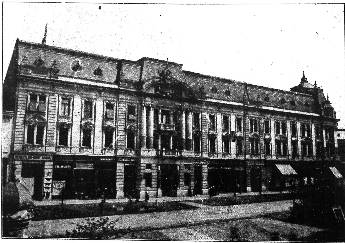
2. ábra. A nyiregyházi takarékpénztár oldalhomlokzata.

Az építés fővállalkozója és a kőműves, ácsmunka és cserépfödés végrehajtója Bleuer Ödön volt; az asztalos munkát a Nyiregyházi ajtó-ablak bútorgyár , a lakatos munkát