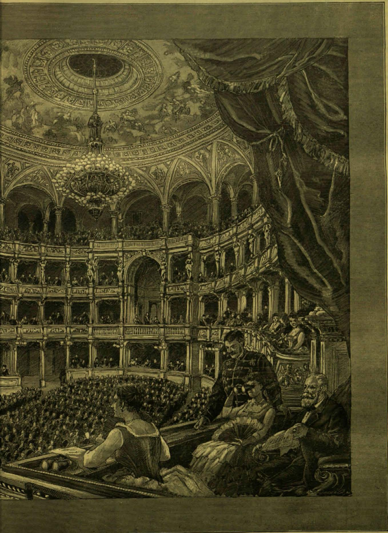
HÉZÓTERE. — DÖRRE TIVADAR EREDETI RAJZA