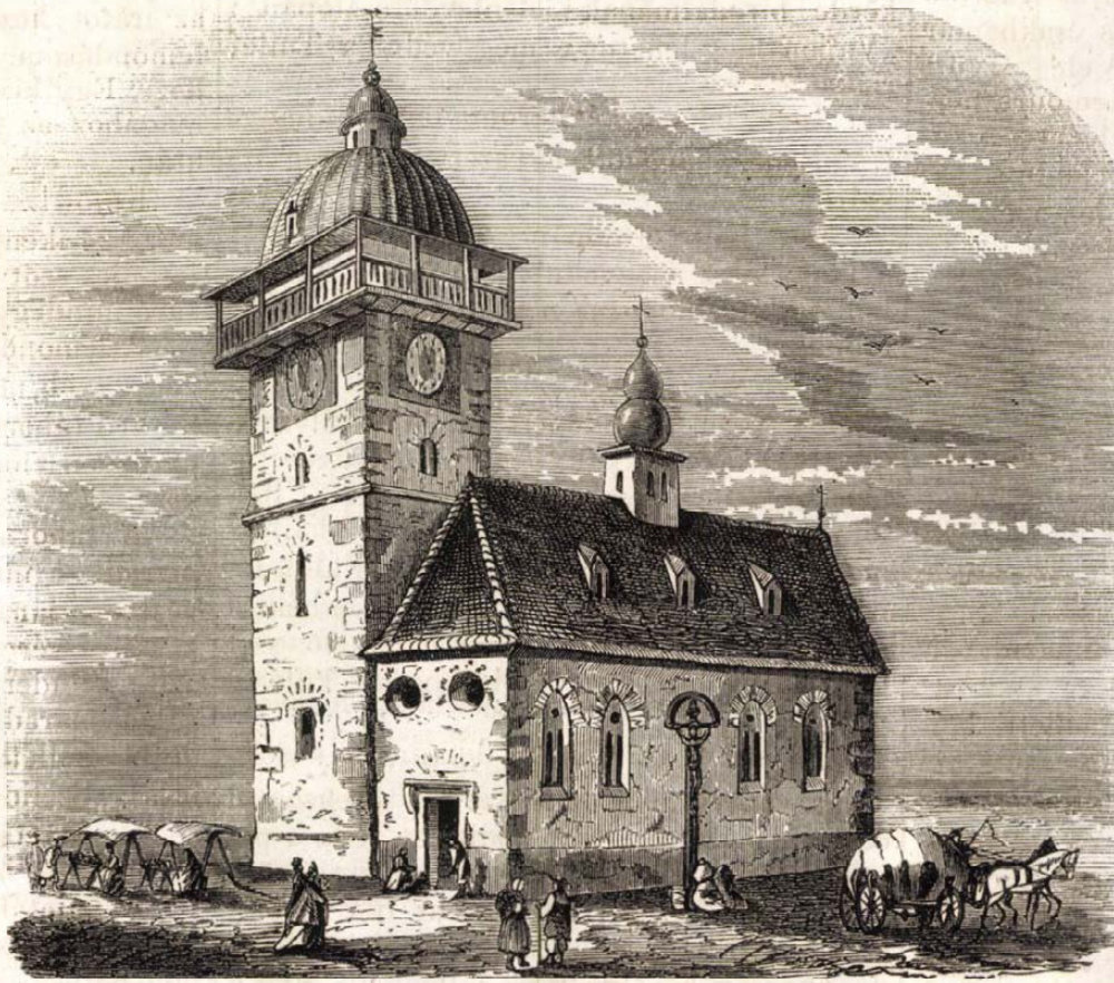
Szepes-Olaszi-i városi torony s régi kis templom.

De a muzeumnak a parkon kívül eső környezete is évről évre szépül, s a körülötte látható ronda házikók vagy üres telkek helyén csinos, nagy házak, valódi paloták emelkednek. Feltűnő, hogy a mult, s különösen a jelen évben, midőn Pesten az építési kedv csaknem végkép szünetelt, épen a muzeum vidékén tünt fel a legnagyobb építkezési buzgalom. A muzeum átellenében, az országúti házsoron ez idén készült el két háromemeletes nagy bérház (a Szeghő- és Geisztfféle); a muzeum háta megett pedig, hol már több év óta áll készen a nemzeti lovarda csinos épülete (l. V. U. 1858. 7-ik szám) két monumentalis uri palota emelkedik, melyek Pest legzebb magánépitményei közé fognak tartozni. — E két palota a muzeum hátsó részével párhuzamosan, a lovardával egy sorban, ez utóbbinak két oldalán terül el. Az egyik a gr. Károlyi-féle palota, melyet néhai gr. Károlyi Lajos kezdett két évvel ezelőtt építtetni, s mint örömmel halljuk, most az időközben elhalt birtokos-fia, gr.