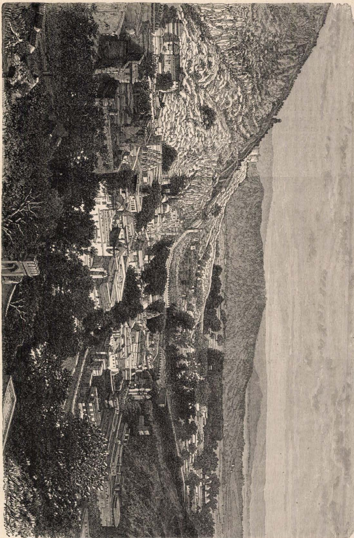
KELETIENDIAI KÉPEK: Amber völgye.

szeget-követ a szentélyben. De az építés lassan folyhatott, mert nem volt reá pénz. Évenként csak 20,000 forintot lehetett reászáni, pedig mi az ily óriási építkezéshez? A magyarországi főpapság nem igen erőltette meg magát az ország fővárosában építendő nagyszerű templom iránti áldozatkészségben; az adományok nem igen csorogtak, alig csöppentek, egészen csak a városra volt nehezdedve az építési költségek terhe, az pedig nem adhatott többet.