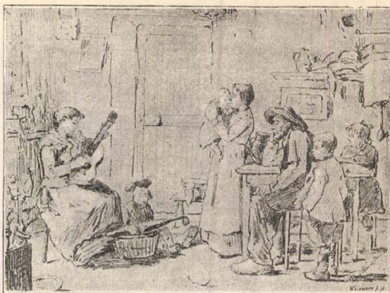
RIPPL-RÓNAI JÓZSI: Külvárosi szoba belseje Párisban. A képzőművészeti társulat téli kiállításáról.