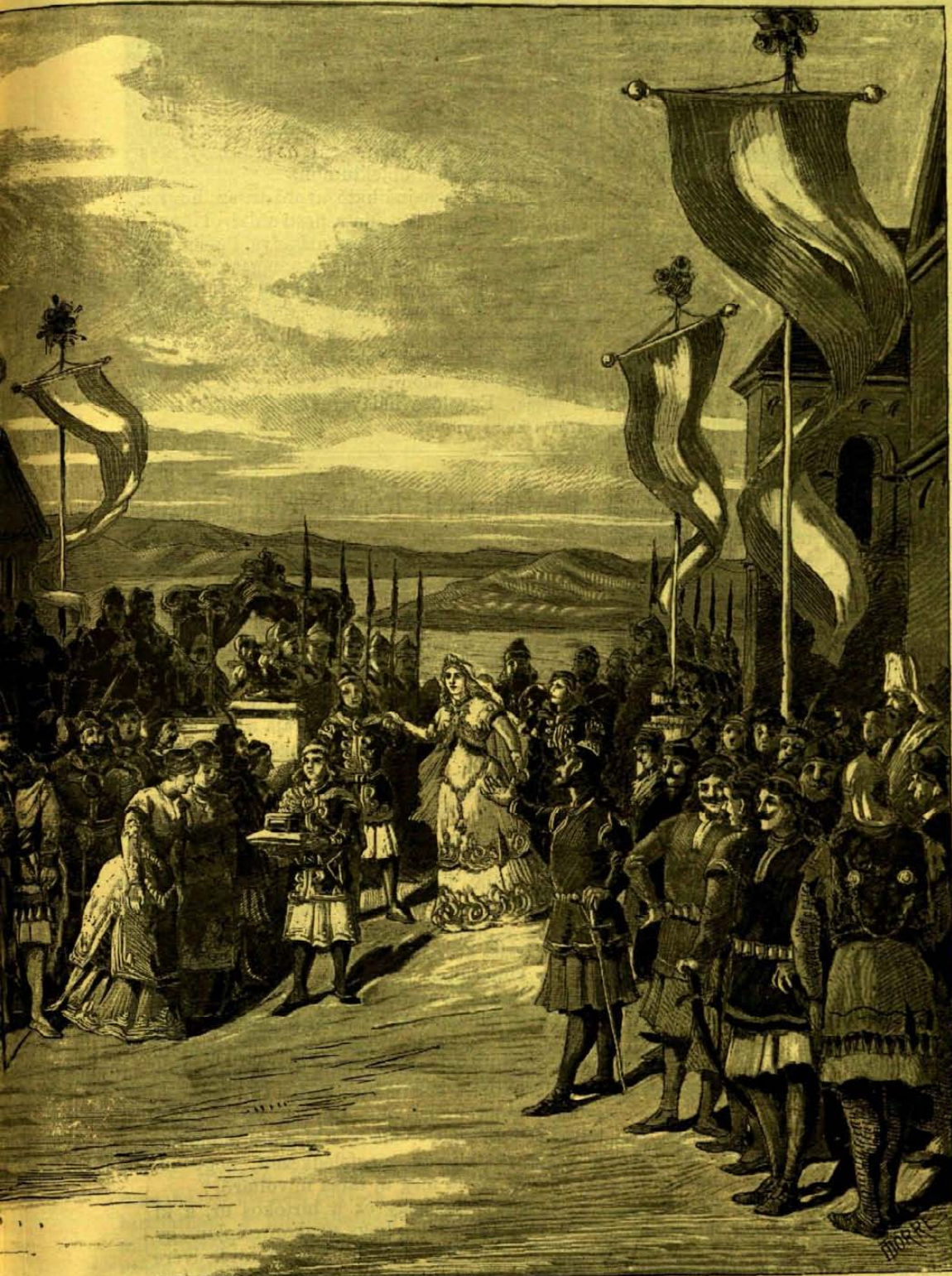
«ISTVÁN KIRÁLY» CZ. EREDETI DALMŰVE II. FELVONÁSÁBÓL.