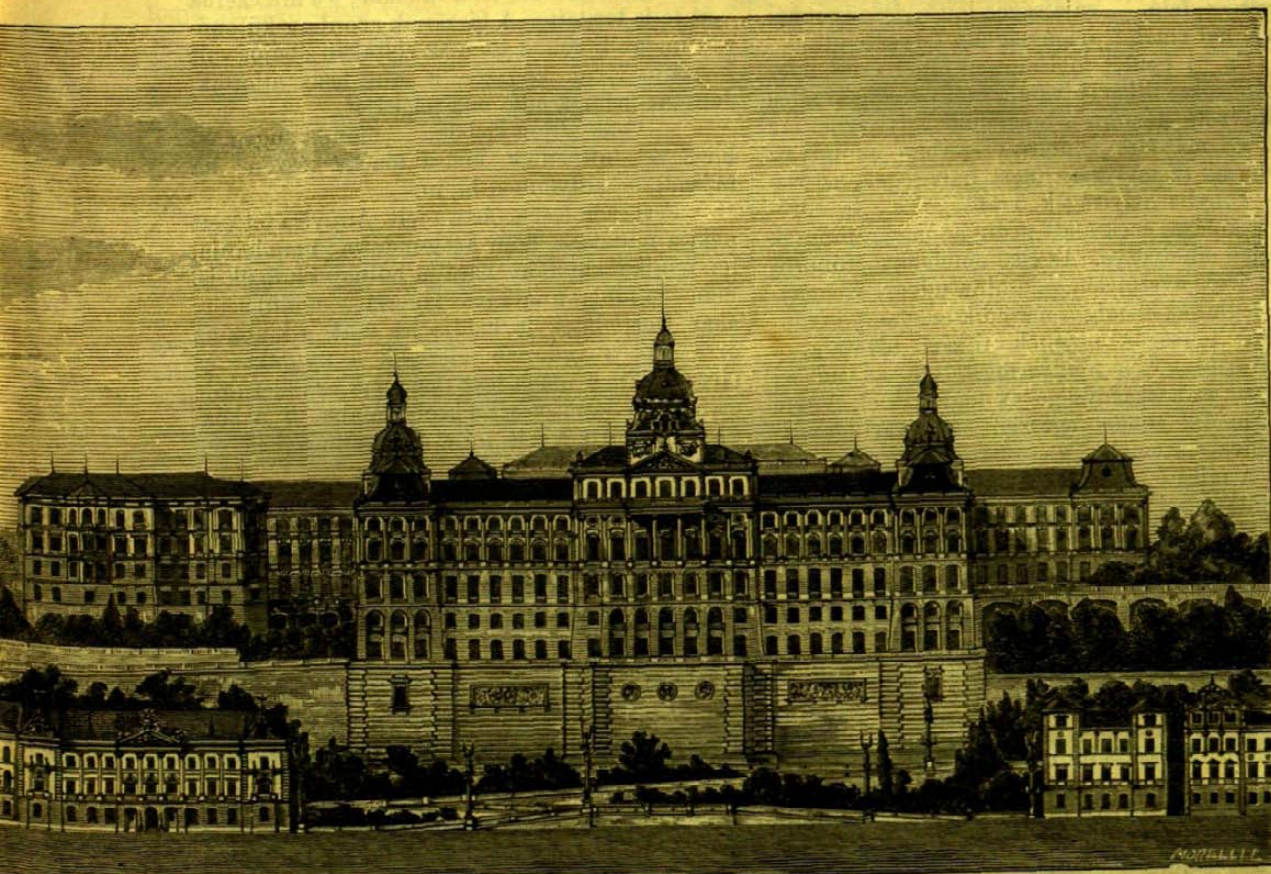
A kir. palota kiépülendő balszárnya.