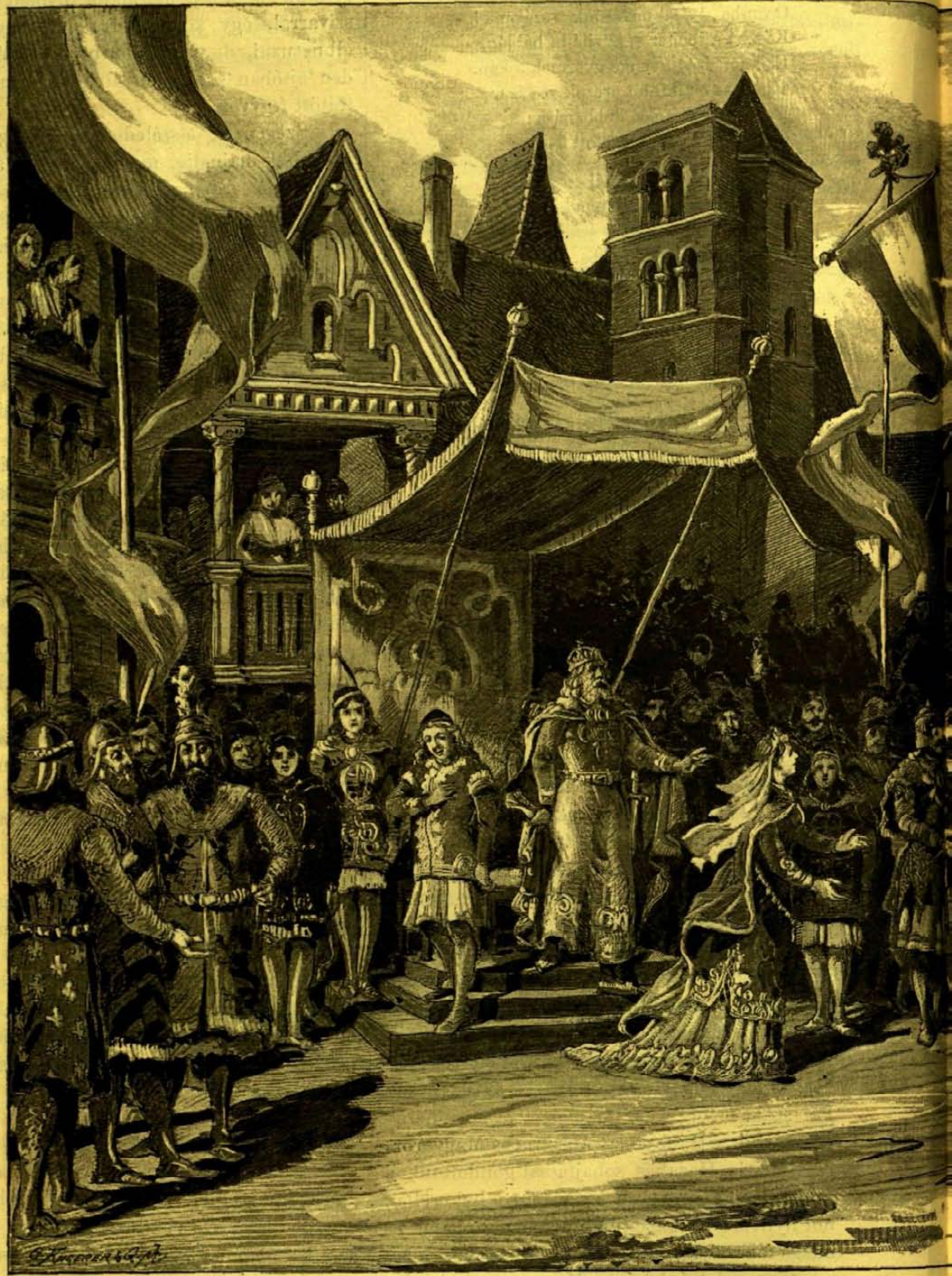
KRESZIMIRA ÉRKEZÉSE. — JELENET ERKEL FERENC