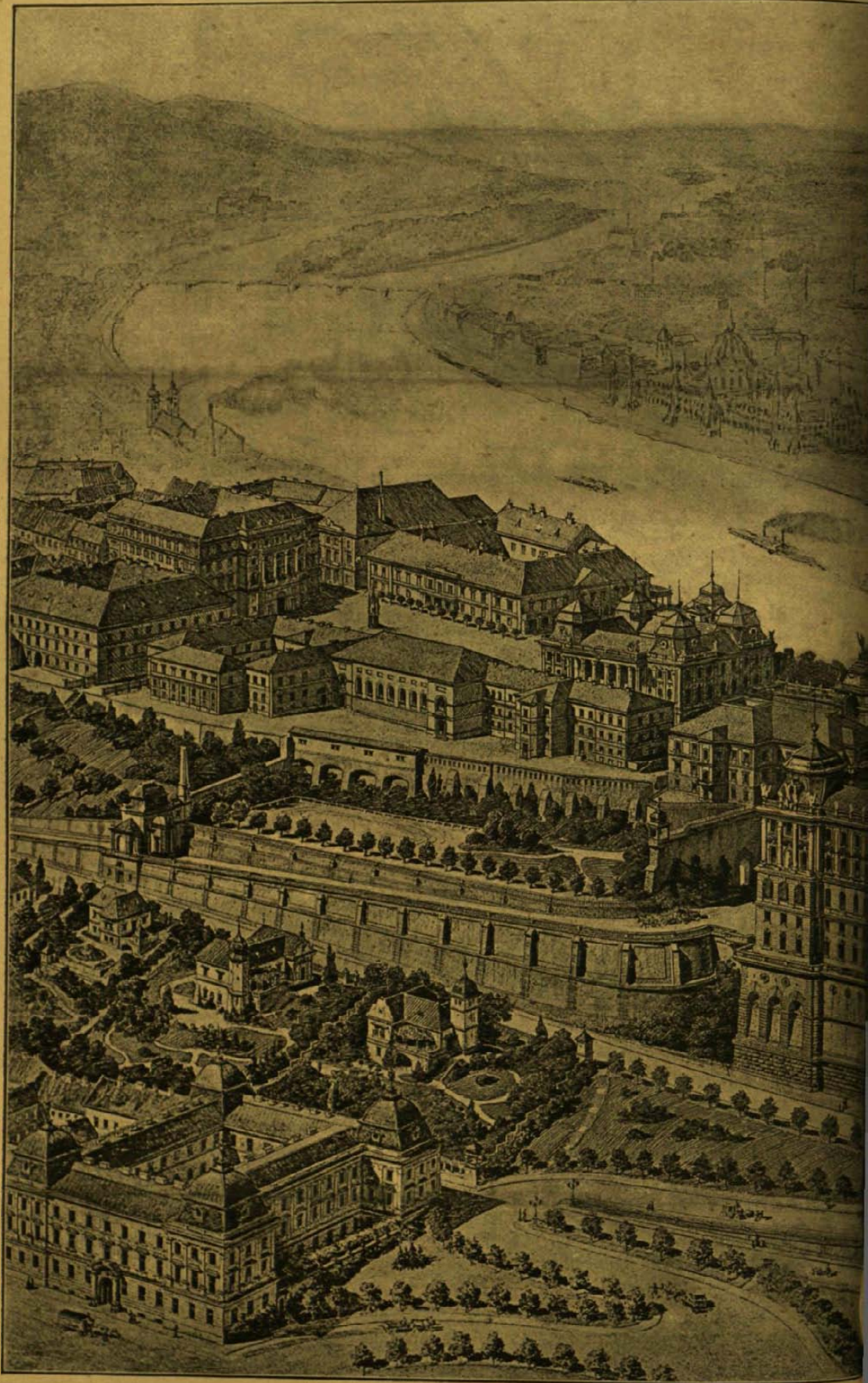
A BUDAI KIRÁLYI VÁRPALOTA A

És most kerül a sor a súlykolásra. Nyárban ez kellemes multság, magam is elnézem gyakran s csaknem megkivánom mint állnak az asszonyok a kis patakban s lábaikat körül tánczolják a tiszta hús fodrocskák; de annál keservesebb multság ez télen: a barna sulykokra ragyogó