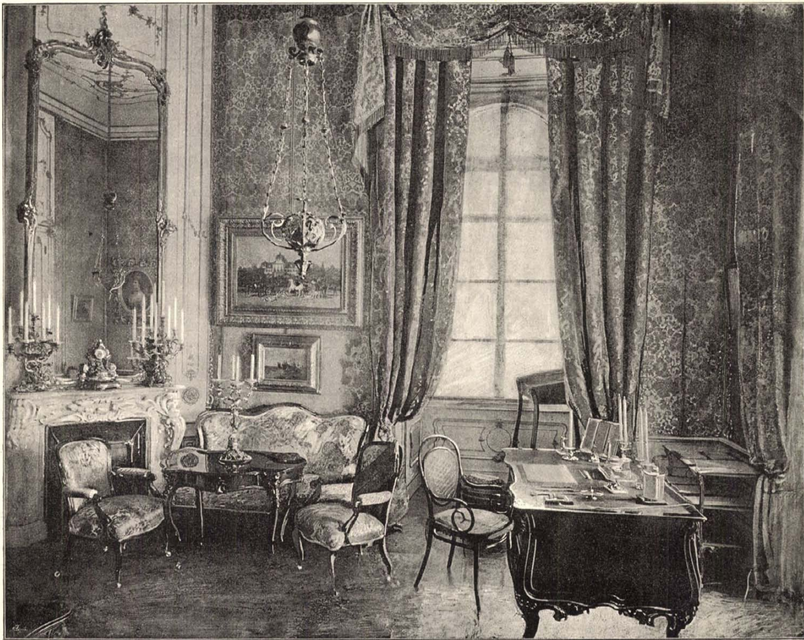
Bárá Stillefried fényképe után.

Ilyen formán kel aztán még el egy sereg mesés