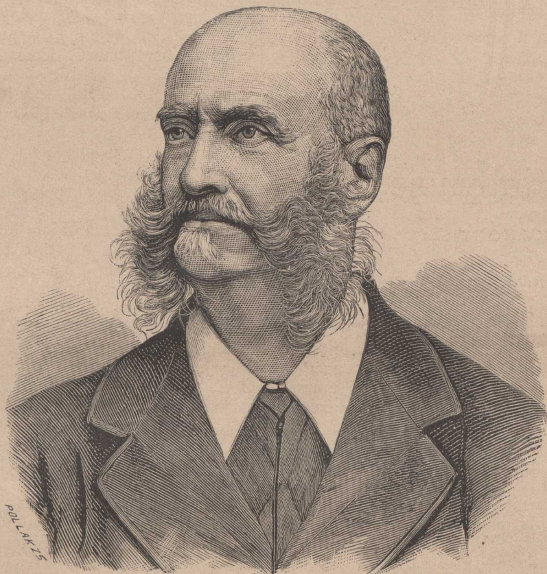
BÁRÓ PODMANICZKY FRIGYES.