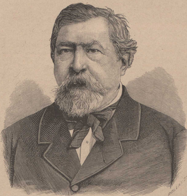
YBL MIKLÓS, ÉPÍTŐ-MŰVÉSZ.