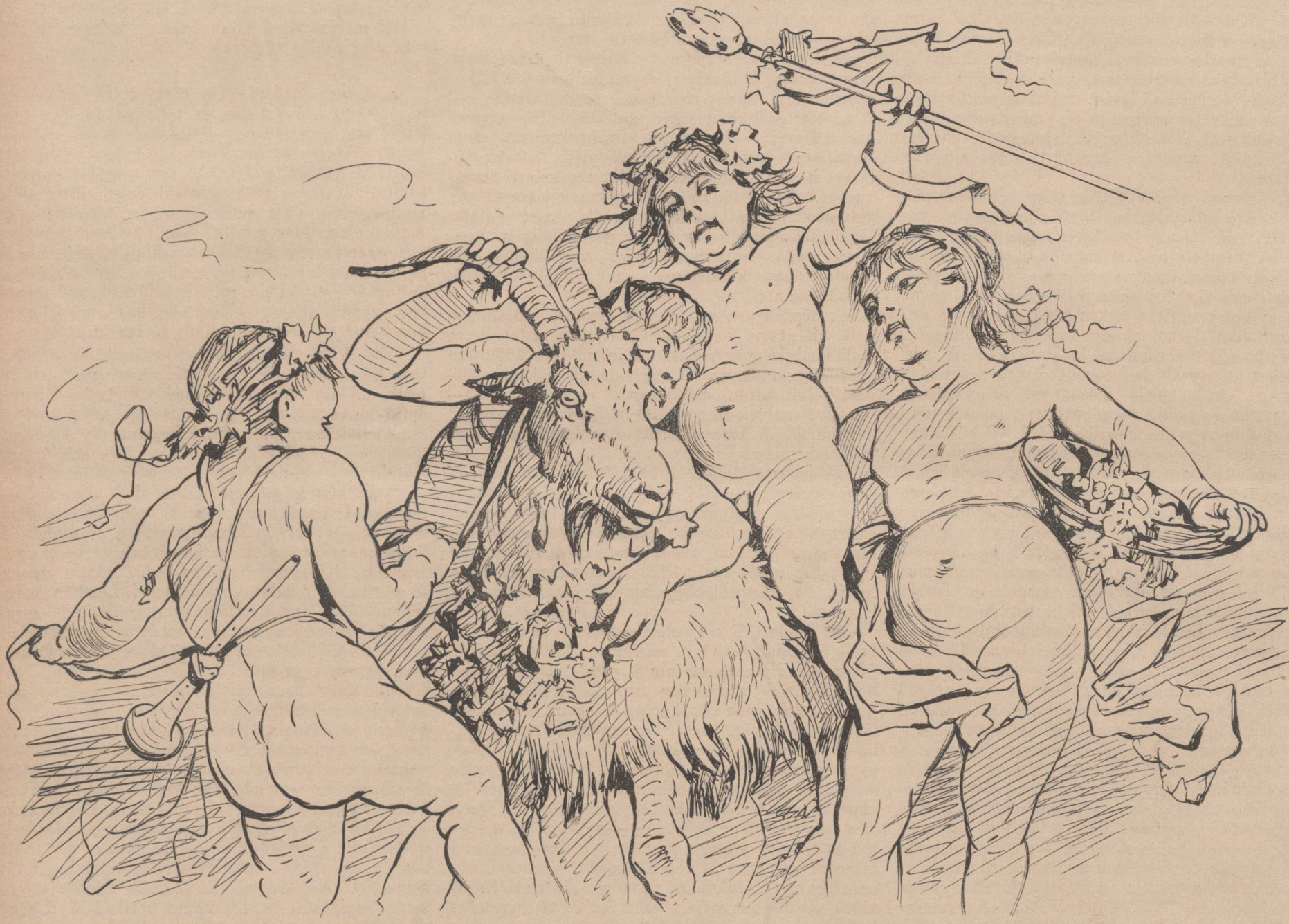
«BACHUS IFJÚSÁGA.» Vastagh György freskója a dalszínház társalgójában.

Egyszer délután hatalmas zivatar lepte meg Beethovent, s a mint az ég symphoniájának fősé-