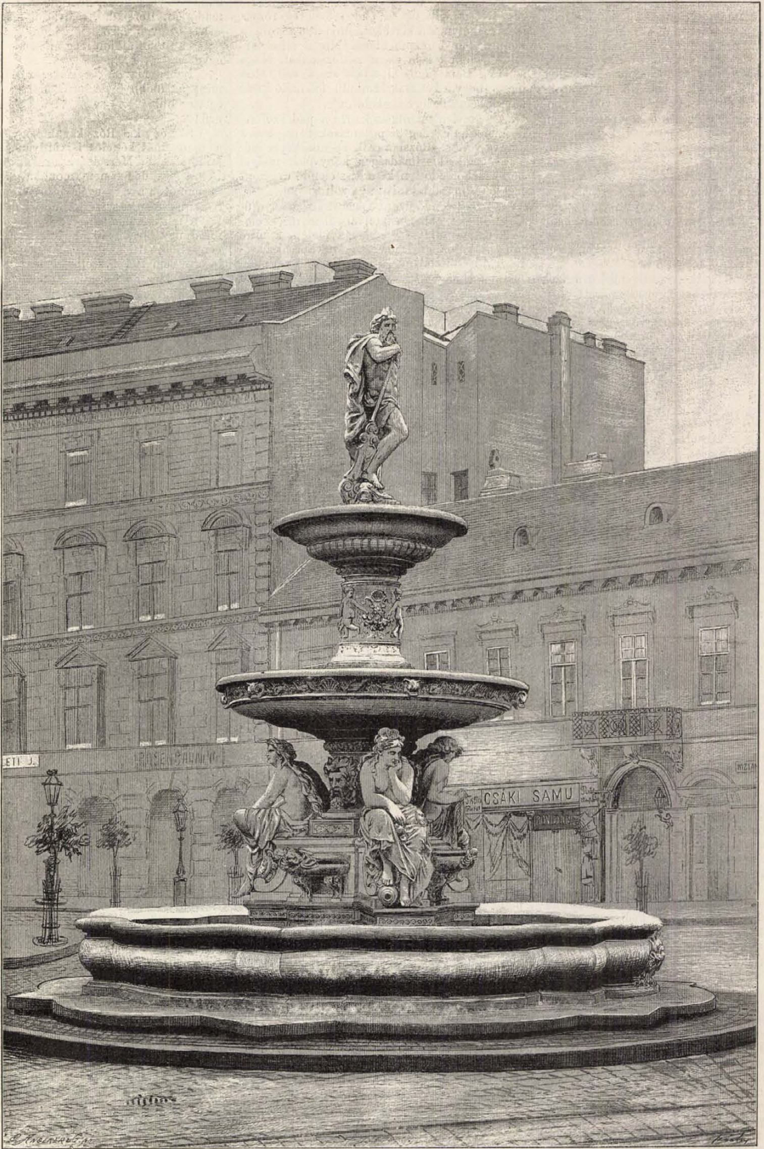
A KÁLVINTÉRI SZÖKŐ-KUT.