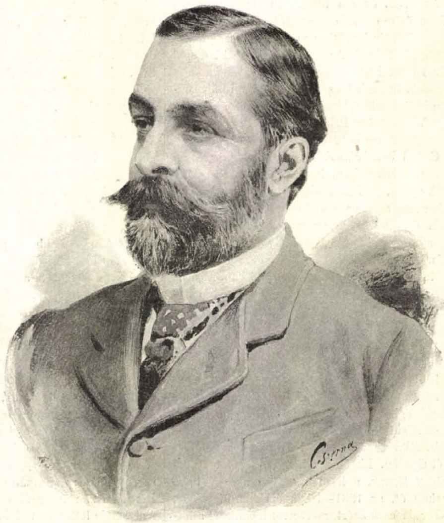
GRÓF WENCKHEIM FRIGYES.